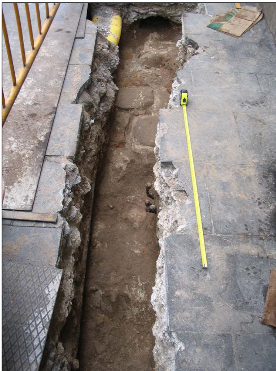
Estructura UE104 apareguda a la rasa del carrer Hospital.