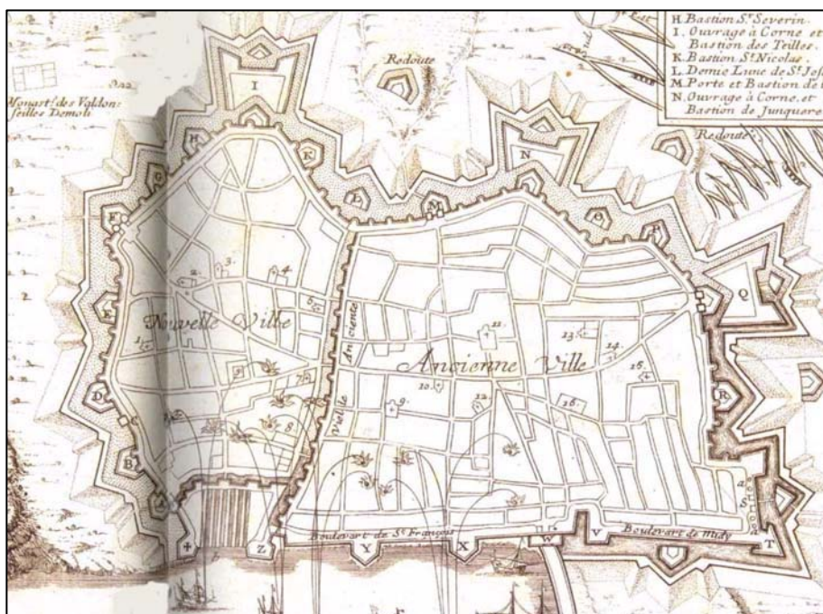
Història de Barcelona. La ciutat a través del temps. Cartografia històrica.

Plànol de Barcelona durant el setge del 1697 en el qual es distingeixen la ciutat antiga i la nova separades per la muralla del segle XIII que discorre per La Rambla i englobades dins el segon perímetre medieval.