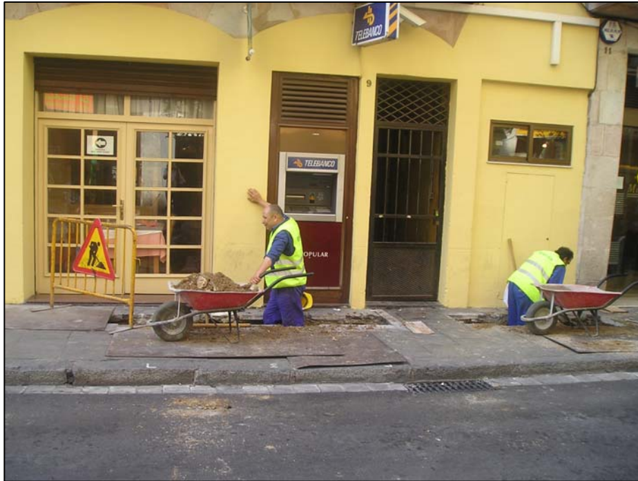
Evolució dels treballs davant el número 3-5 del carrer Hospital