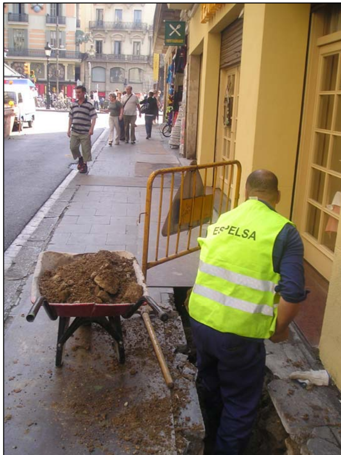
Carrer Hospital amb Rambla.